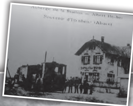
Station d'Ittenheim vers 1914.