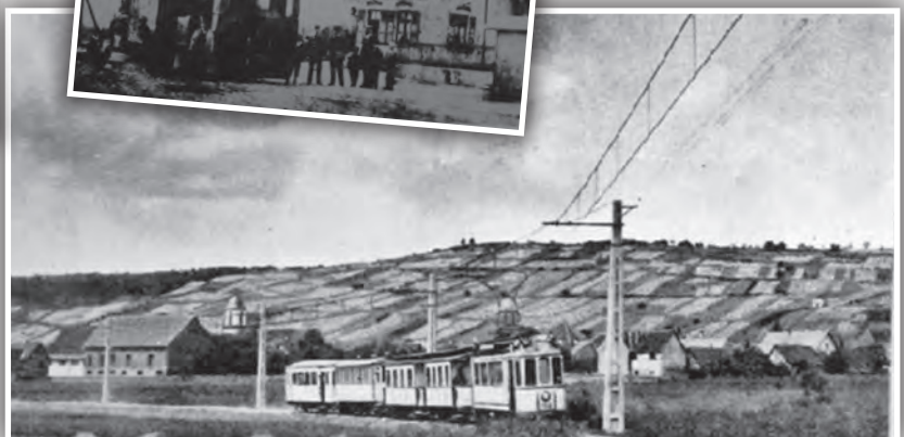
Près de Marlenheim