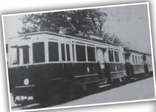
Tramway quittant Marlenheim en direction de Ittenheim en 1925 sur la ligne nouvellement électrifiée. (Coll. Michel Grass Stutzheim)

(Source: ouvrage «Ittenheim-Handschuheim, deux clochers, une âme»)