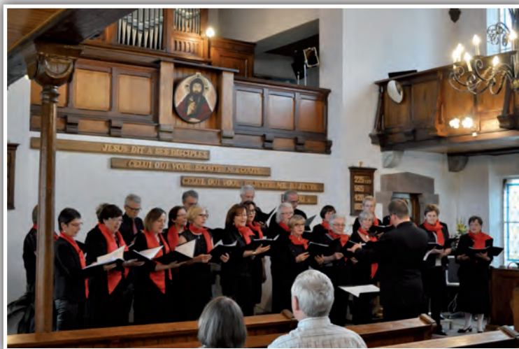
Chorale juin 2015 à Obernai