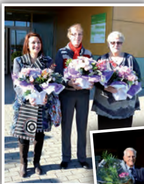
3 générations de maires